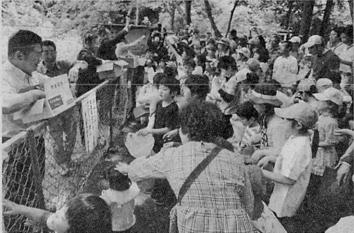
子供たちに人気の投げ餅