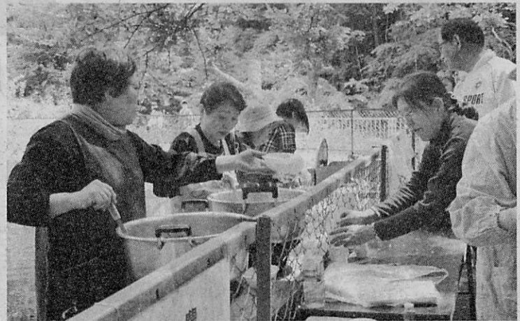
手作りのそばを提供

第17回大岩堤祭りが3日、同区の大岩堤周りで行われた。今年のはじめに「イワシ」を模したわら人形の展示や奉納弓道などが行われ、例年以上の来場者でにぎわいを見せた。