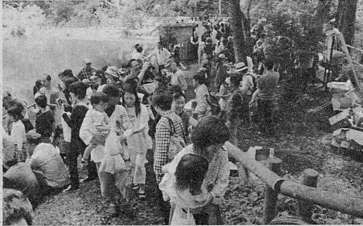
多くの人々ににぎわう会場