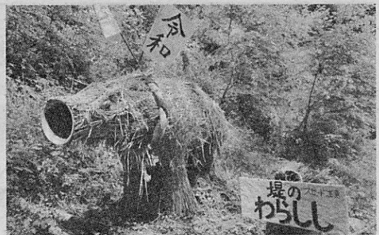
わらで作った「ワラシ」(上)、プレゼントされた「ししぼっくり」

住民が会場を訪れた。企業や区民が協力して厳かな神事の後、富士岩にわらをかぶせた宮市琴平弓道会の協力「イワシ」とわらで奉納弓道を実施。堤で作った「ワラシ」の一部に掲げられた「イワシ」なども展示。来場者には「亥」と書かれた的に矢を射る「ししぼっくり」などを無料配布した。