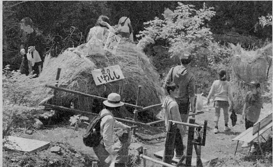
岩にわらをかぶせた「イワシ」などを展示