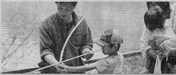
射的ゲームに挑戦する子供

同日は大型連休の後半ながらも多くの地域住民が会場を訪れる機会にしている。池の中央には花で飾られた看板が付けられ、水神の下には地元