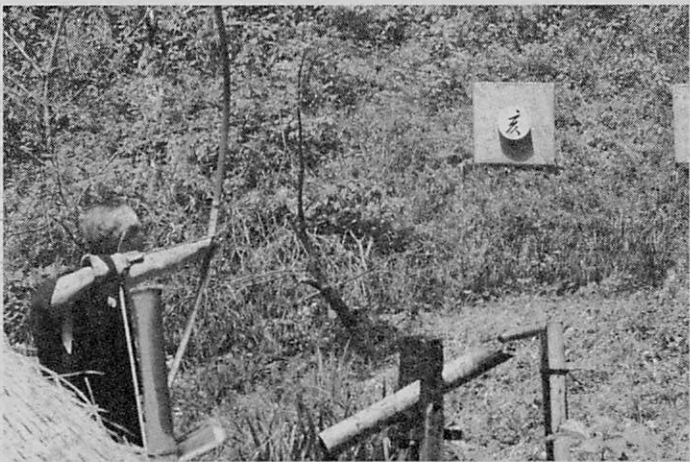
「亥」の的に向かって矢を射る