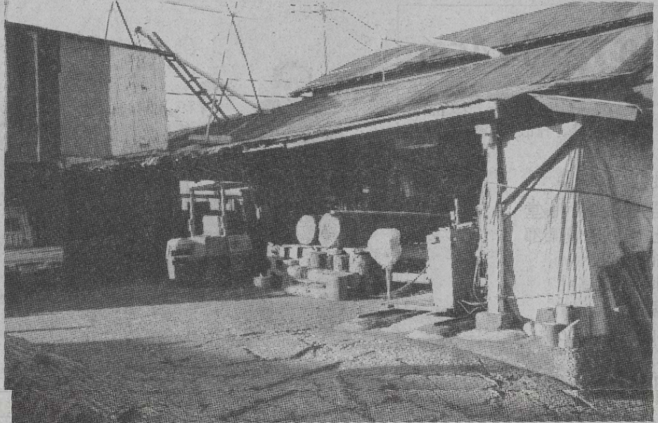
県道397号線大岩交差点